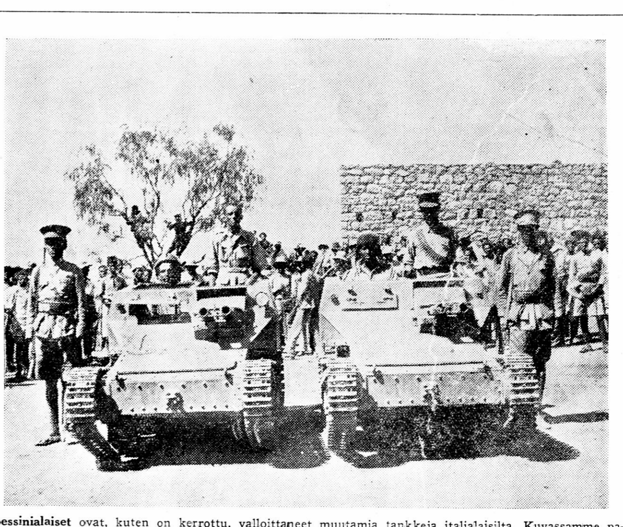
Abessinialaiset ovat, kuten on kerrottu, valloittaneet muutamia tankeja italialaisilta. Kuvassamme pari tällaista suurta ihmettelyä herättävää "ryömiäjä".